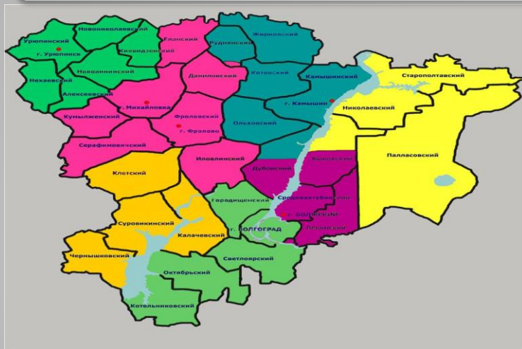
Кластерное деление в сфере обращения с отходами Волгоградской области

Организована работа по привлечению инвесторов