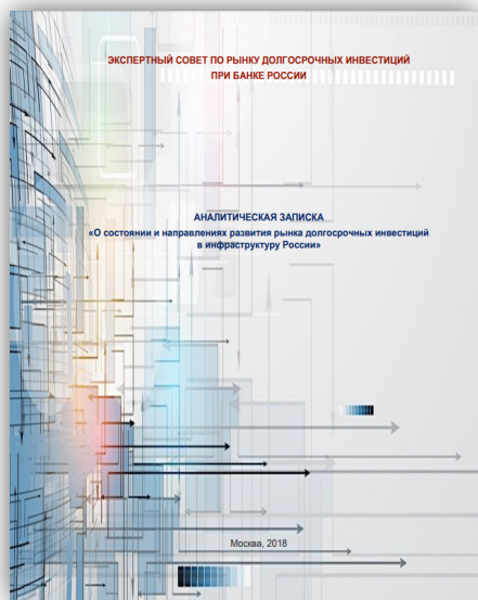
Analytical Paper «On the conditions and development of the long-term infrastructure investment market in Russia»