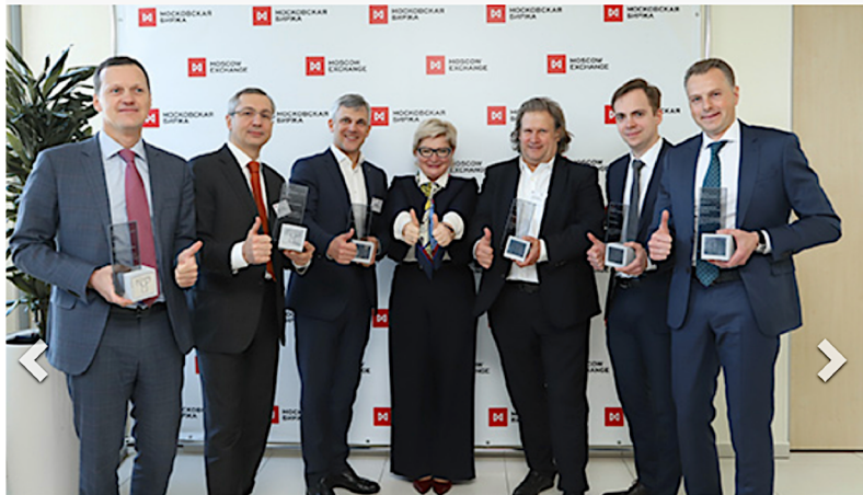
НАКДИ провела на Московской бирже Отчетную сессию концессионеров

в месяц на скачивание аналитических материалов